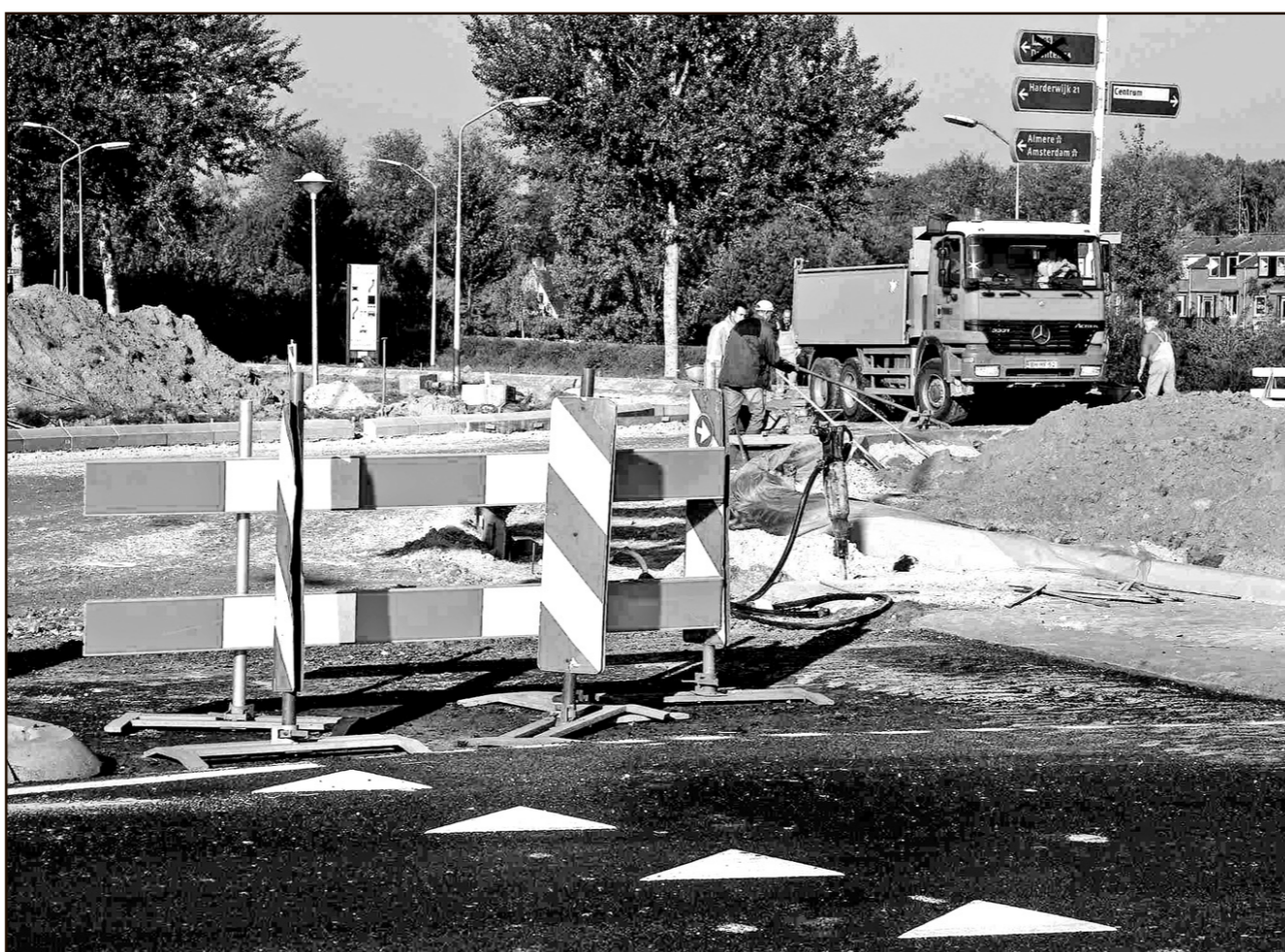
Flevoland is nog niet 'af': dorpen en steden, infrastructuur, cultuur, natuur, er gaat in heel veel opzichten nog flink worden gebouwd in en aan Flevoland. (Foto: Fotostudio Wierd).

waarbij de veiligheidsbeleving en gezondheidsvoorzieningen belangrijk zijn. De dorpen moeten meer ruimte krijgen om zich te ontwikkelen, met versterking van de leefbaarheid als uitgangspunt.'